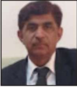
تحریر: خولید سیف الرحمان

ٹیکلر ایڈیٹر لگو سکتے ہیں نیز ایئر پورٹس پر بھی یہ سہولت فراہم کر دی گئی ہے جس سے ہزاروں لوگ استفادہ کر رہے ہیں۔ اسی طرح وزارت خارجہ کے دفتر اسلام آباد کے علاوہ لاہور، بھارت اور کراچی سے بھی دستاویزات کی اپنا سائل تصدیق کا آغاز ہو چکا ہے جس سے بیرونی ممالک میں مقیم اور بیرون ملک جانے والے پاکستانیوں کو خاصی سہولت حاصل ہو گئی ہے۔ مزید برآں سال 2025 میں وفاقی محتسب کے دفتر میں تمام متعلقہ ایجنسیوں کے سینئر افسران سے ہونے والی مسلسل میٹنگز کے نتیجے میں تادرنے حال ہی میں Pak ID App کا اجرا کر دیا ہے جس کے باعث بیرون ملک مقیم پاکستانی پشاور گھر بیٹھے ہی اس ایپ کے ذریعے تصدیق نامہ حاصل (Proof of Life) فراہم کر سکیں گے اور انہیں ہر چھ ماہ کے بعد بینک یا انسٹیٹیوٹس میں جانا پڑے گا۔ مختصر یہ کہ وفاقی محتسب کا سہولتی ایپ شہر آفس اپنے قیام سے لے کر اب تک پوری تن دہی کے ساتھ اور بیرون پاکستانیوں کی خدمت میں مصروف ہے اور وقت کے ساتھ ساتھ اس کے دائرہ کار میں وسعت لائی جا رہی ہے، جس کا اندازہ اس امر سے لگا جا سکتا ہے کہ سال 2025 میں اس دفتر کی طرف سے مجموعی طور پر 135,559 اور بیرون پاکستانیوں کی شکایات کا ازالہ کیا گیا، انہیں سہولیات فراہم کی گئیں اور ان کے مسائل حل کئے گئے